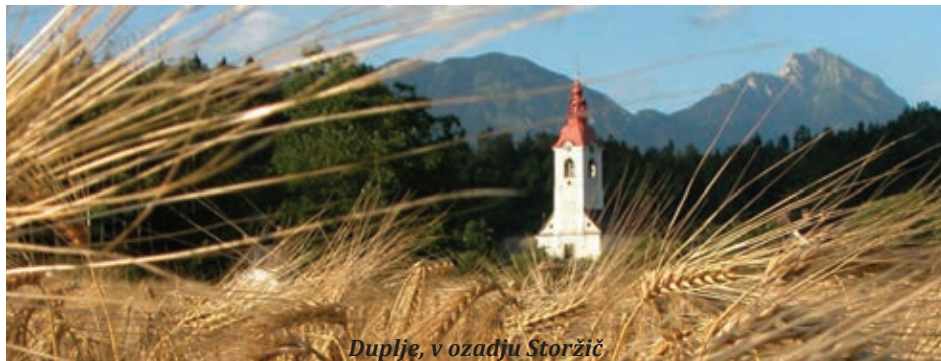
Duplje, v ozadju Storžič