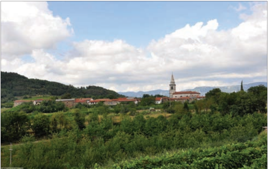
Goče pri Vipavi

Ko sem se vrnil na Goče, se je že bližala jesen, šola, trgateg, kar je prineslo nove skrbi. Z novim šolskim letom se je začela