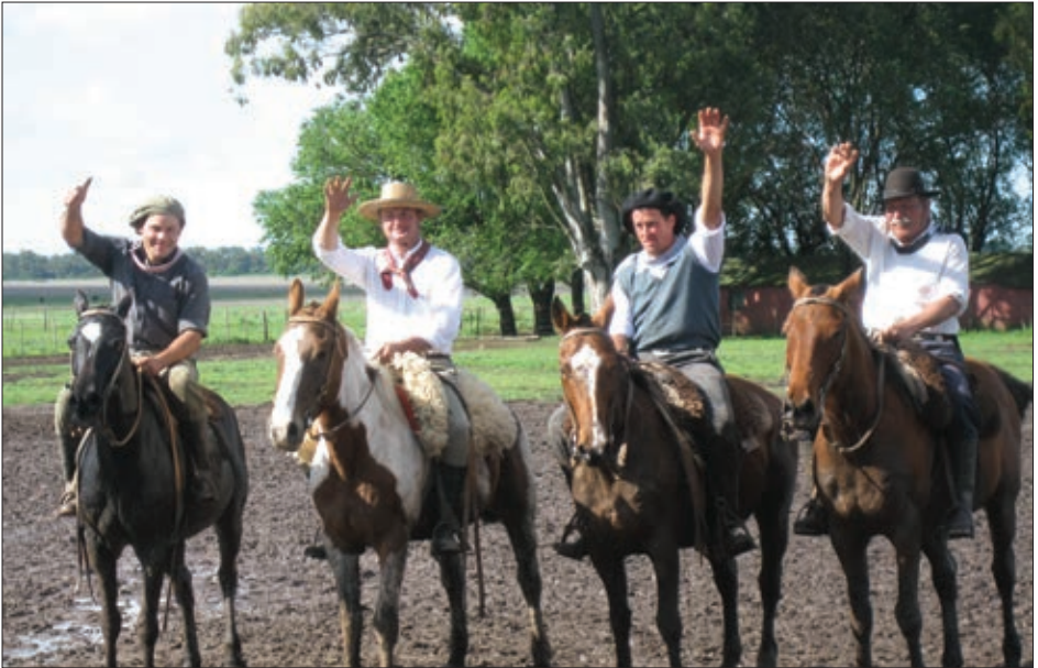
15.10.2016: RANČ SANTA SUSANA, kjer so nas sprejeli Gavči, postregli mesne dobrote, ki jih spečejo na žaru čisto drugače kot mi, pa prav počasi! Na odru so zaigrali in zaplesali. Vreme se je spet zjasnilo, Gavči so zajahali konje, pokazali svoje običaje in strmeli smo kot še nikoli doslej.