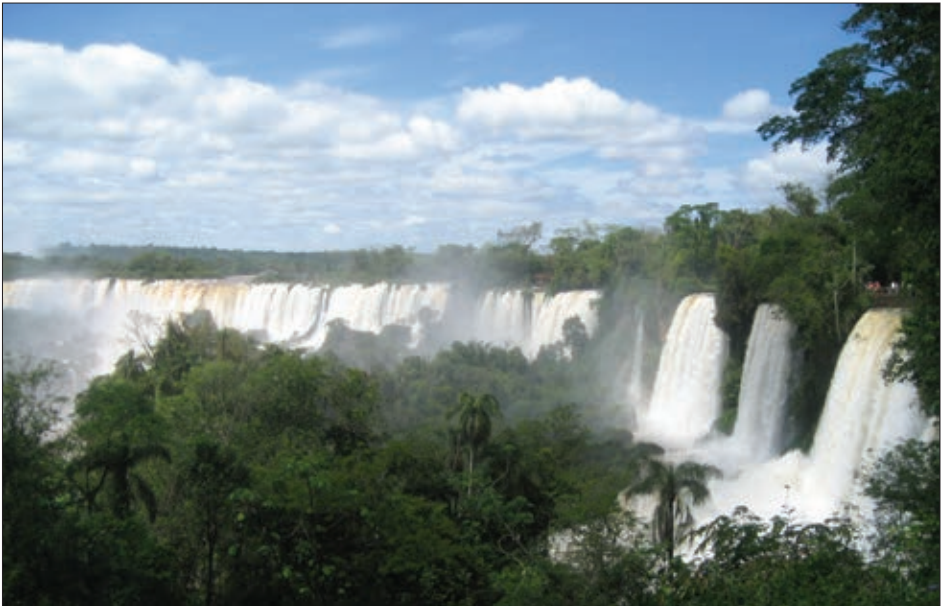
NA ARGENTINSKI STRANI smo se popeljali z vlakom skozi džunglo in soteske, nekaj smo jih prehodili peš, spet veliko videli in poslikali, jaz pa sem šel - edini iz naše skupine - še s čolnom pod Hudičevo žrelo in nato s tovornjakom skozi džunglo. Doživetje, kot ga sicer vidimo samo v filmih!