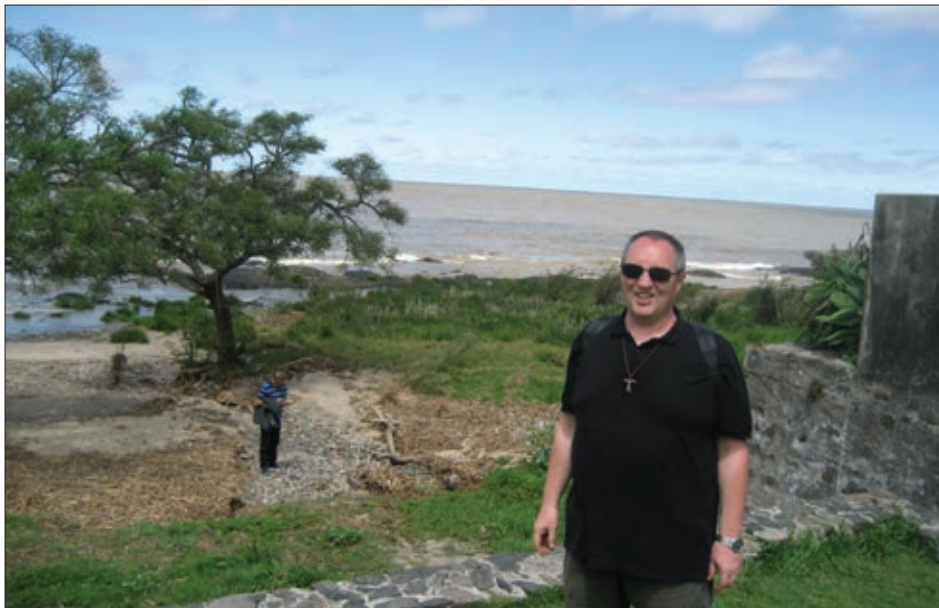
17.10.2016: COLONIA, URUGVAJ: S trajektom smo šli po Srebrni reki, dobro uro od Buenos Airesa, v Colonia, Urugvaj, in preživeli lep sončen dan v tipično ohranjenem starem mestu, kot so ga zgradili Španci in Portugalci. Novi del mesta, turistično naselje se nadaljuje ob bližnjem zalivu.