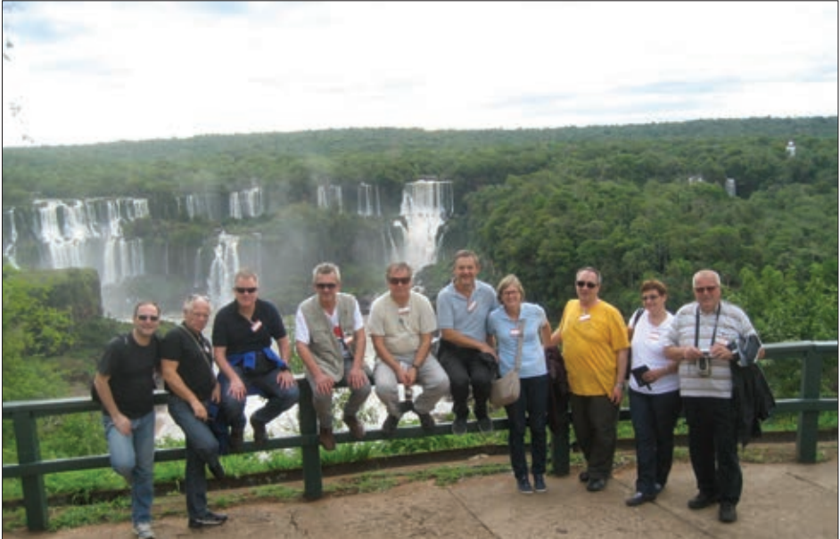
13. -14.10. Z JUGA SMO ŠLI NA SEVER - K SLAPOVOM IGUAZU (1000 km od Buenos Airesa proti severu). Najprej smo se odpeljali v Brazilijo. Slapovi so vsi na argentinski strani, toda z brazilske strani je razgled lepši in imamo kaj videti in slikati!