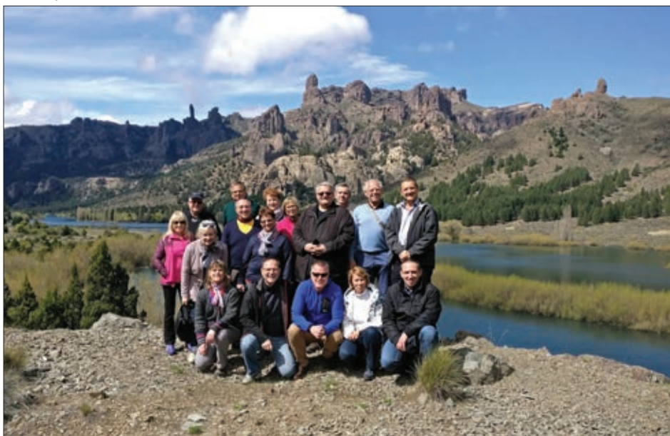
ZVEČER smo odpotovali v BARILOČE, 1700 km od prestolnice, kjer smo občudovali lepote gorskega sveta in čudovita jezera. Marsikateri kraji, hribi, naravne poti se imenujejo po slovenskih planincih. Žal nismo imeli lepega vremena, da bi si vse ogledali, toda z molitvijo smo izprosili nekaj sonca.