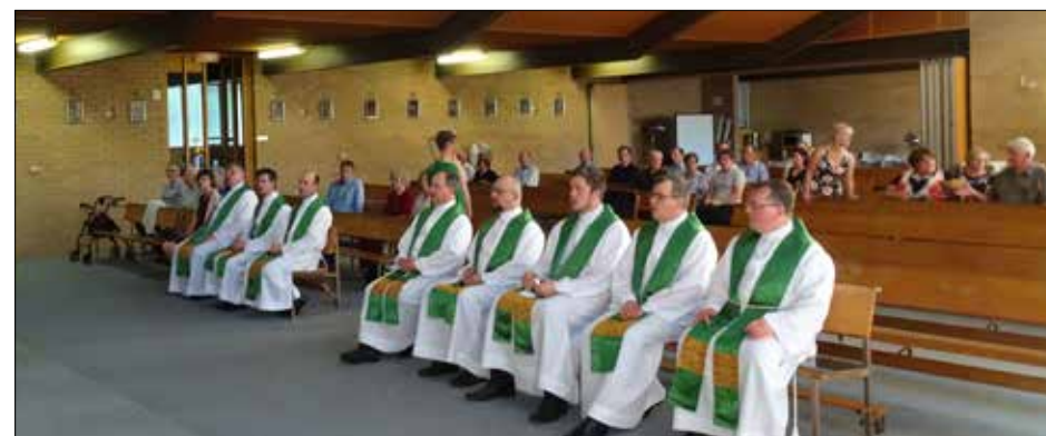
CANBERRA: Zvečer smo somaševali v cerkvi sv. Petra in Pavla. Domači cerkveni pevski zbor in zbor duhovnikov sta prav doživeto odmevala pod oboki moderne cerkve. Po koncertu v cerkvi smo se zbrali k večerji na Slovensko-avstralskem društvu v Phillipu, ACT.