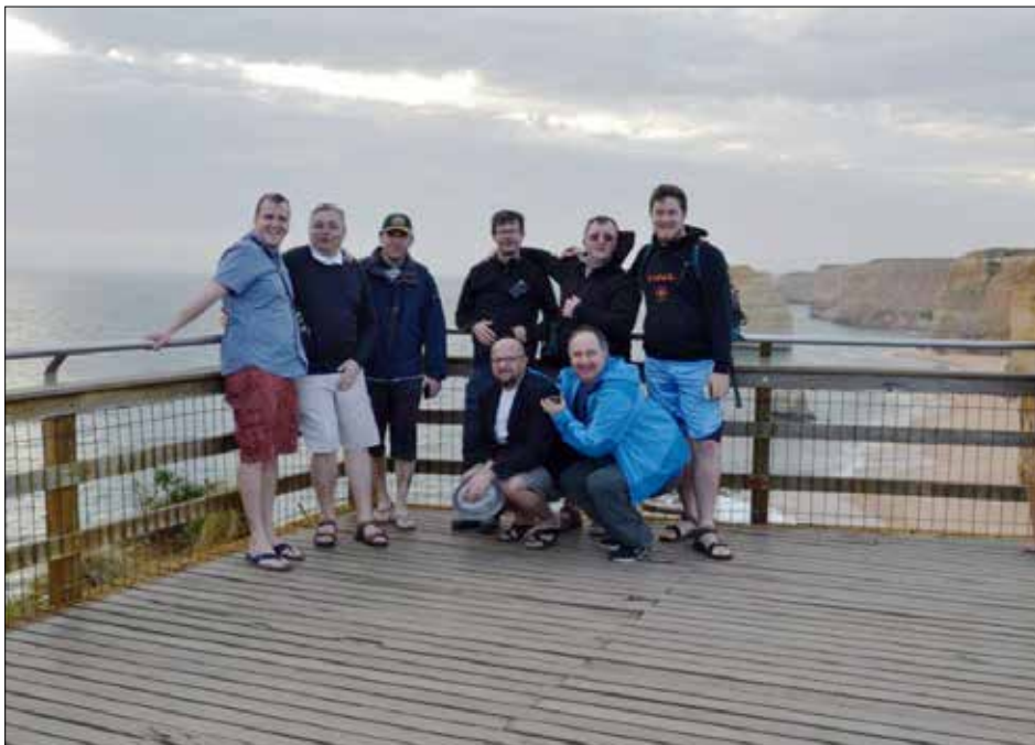
Na poti v Adelaide - pri Dvanajstih apostolih. Narava res naredi svoje, nekateri so tukaj potopljeni, zato pa apostoli v Cerkvi držijo - in mi in Vi moramo (z)držati, kajne?