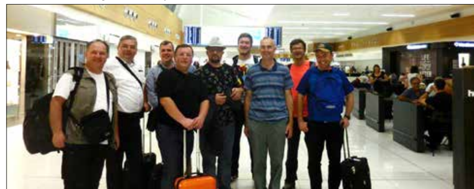
27.2.2017: In še zadnja večerja in pozdrav - z adelaidskimi rojaki tukajšnjim rojakom, preden smo si rekli, da se vidimo še kdaj. Srečno vsem in Bog povrni za tolika doživetja, gostoljubje in dobrote!