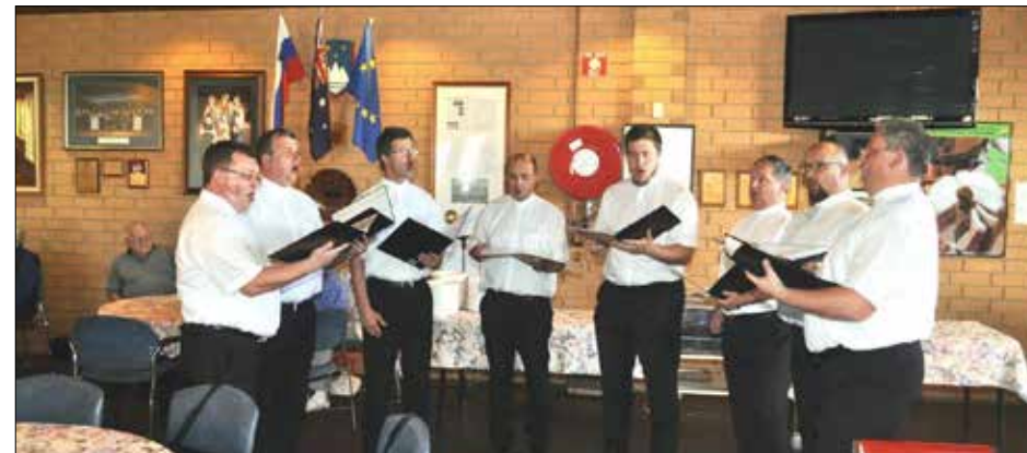
26.2.2017: Popoldne je oktet Oremus nastopil na Slovenskem klubu v Adelaide. Tudi gospodinjam v kuhinji in predsednici kluba so se zahvalili s pesmijo.