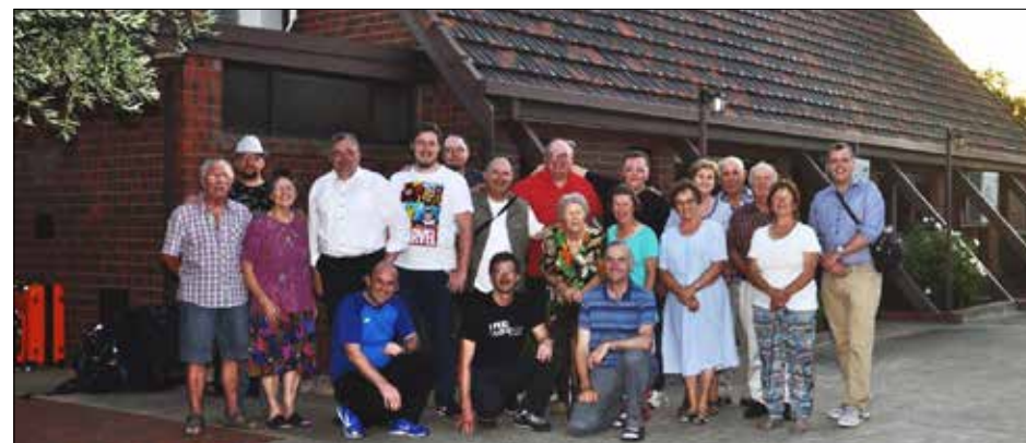
Slovo ob odhodu pred cerkvijo v Adelaidei