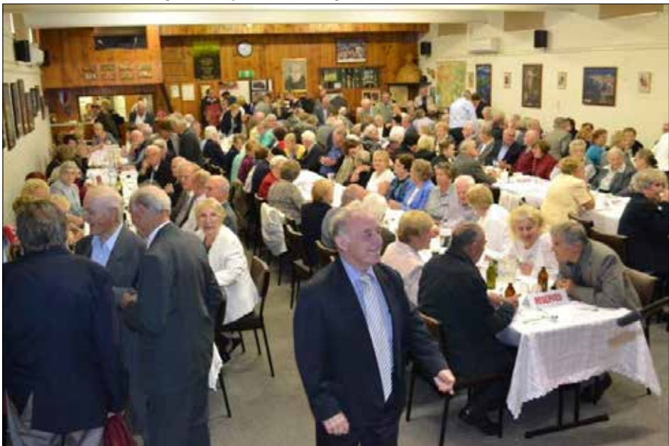
19.2.2017: Sv. maša v Kew, družinsko kosilo in koncert v dvorani so privabili največ ljudi. Slovenska pesem je odmevala še dolgo popoldne. Popoldne smo obiskali katedralo v Melbournu in si ogledali mesto.