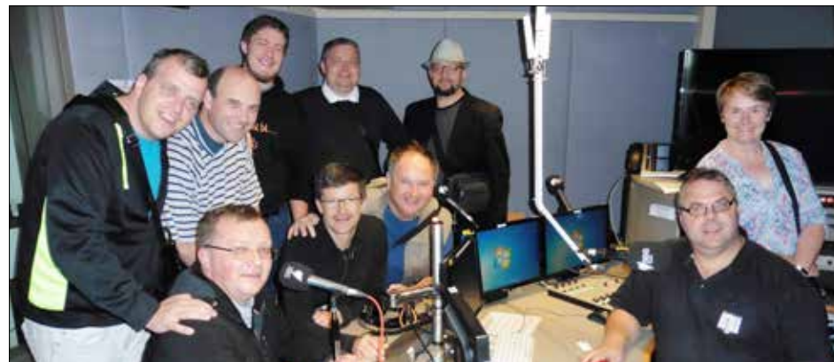
Oktet Oremus v studiju radia SBS v Melbournu