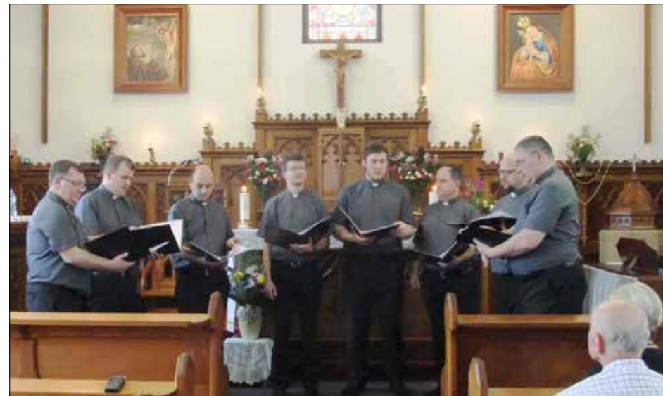
12.2.2017: Popoldne je oktet Oremus pel pri sv. maši v naši cerkvi vseh svetih v Wollongongu - Figtreeju. Po kratkem koncertu v cerkvi smo povečerjali skupaj v dvorani in že dolgo nas ni bilo tako veliko skupaj! Hvala Vam, rojaki!