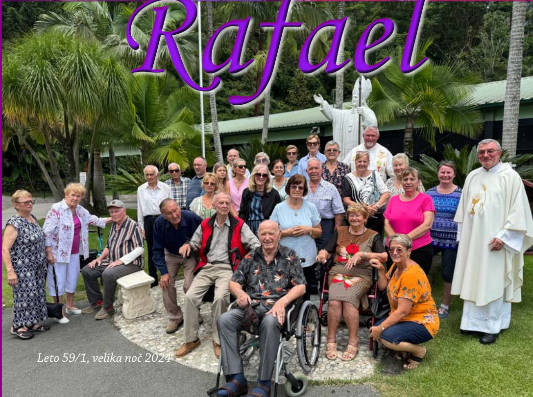
Leto 59/1, velika noč 2024