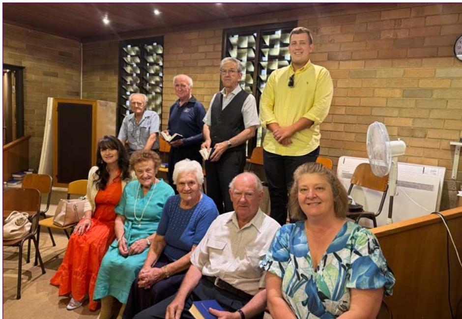
Naš mešani cerkveni pevski zbor.