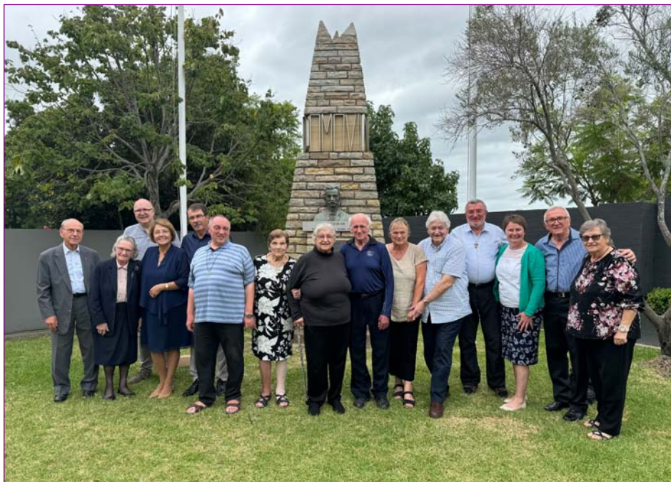
Srečanje na Klubu Triglav Mounties.