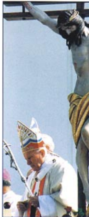
Papež Janez Pavel II. med slovesno sveto mašo, posvečeno 1950 letnici krščanstva na Slovenskem v Stožicah - v Ljubljani, 18. maja 1996, okrog njega je bilo 105 000 vernikov.

Posebno poglavje zasluži področje razglasitve za blažene in svetnike, skupno kar 1828 oseb, ki so dosegle čast oltarja.