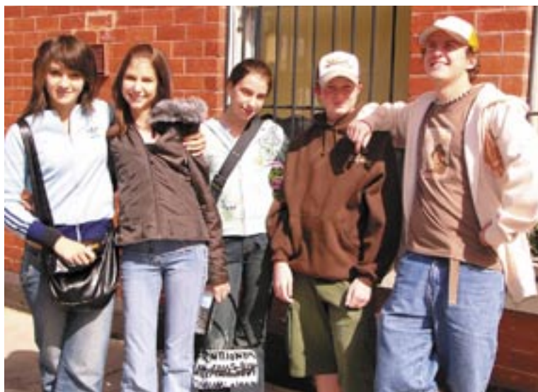
Plesalci folklorne skupine pred vajami.