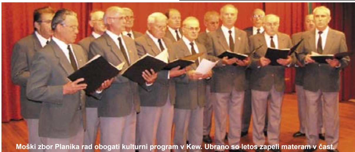
Moški zbor Planika rad obogati kulturni program v Kew. Ubrano so letos zapeli materam v čast.