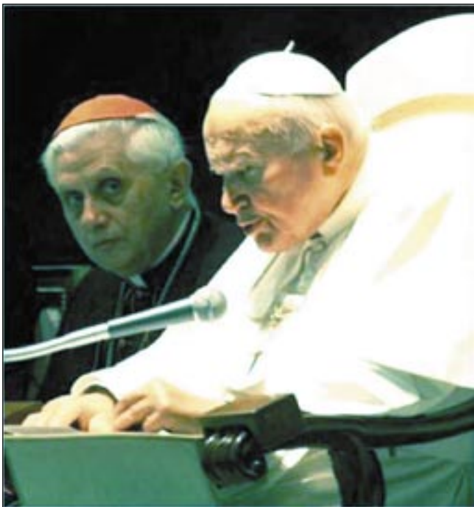
Janez Pavel II., ob njem kardinal Joseph Ratzinger.