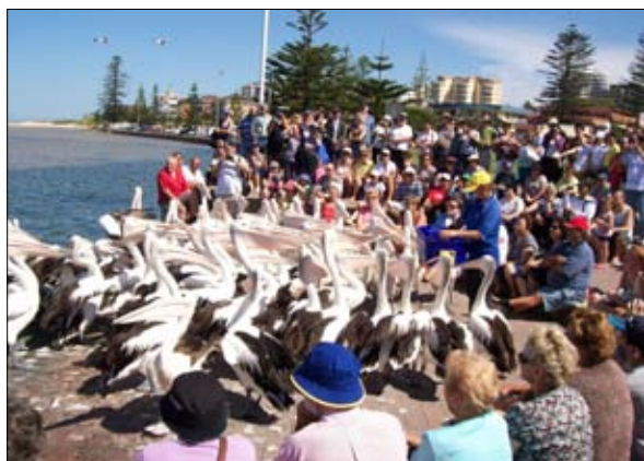
Pelikani, pelikani in še pelikani.