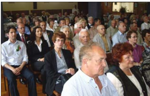
Na 12. Slovenskem festivalu - pri sveti maši.

vsak mesec. Lahko bi bil agent za migracijo in pa pisec prošenj, prevajalec, overovitelj podpisov uradnih dokumentov, kar vse to že tako in tako delam. Ampak dan s 24 urami je prekratek... Izseljenski duhovnik je polno zaposlen delavec v pastoralni, kulturni, šolstvu, socialni (sem še kako spadata naš dom za ostarele in hostel), medijih – pravzaprav na vseh področjih življenja skupnosti, ki je od matice oddaljena osemnajst tisoč kilometrov in od vsega začetka z velikimi naporimi in prizadevanji ohranja materino dediščino jezika, kulture in vere v deželi, ki je pred dobrimi 220 leti nastala z migracijo. Tudi dober gospodar mora biti, saj ima v Melbournu na skrbi veliko staro hišo - Baragov dom, cerkev in dvorano, še eno hišo, z zaupniki mora bdeti nad poslovanjem Doma matere Romane, ... Hvala Bogu, da imamo toliko dobrih sodelavcev – prostovoljcev, da je vse urejeno in lepo teče! Vpet in aktivno pa mora biti vključen tudi v novo okolje nove domovine z novim jezikom, kulturo, navadami in seveda v krajevno Cerkev, katere del je tudi slovenski misijon in seveda naš poseben privilegij je živa povezanost z avstralskimi brati frančiškani, ki nas poznajo in cenijo ter nam pomagajo že vse od prihoda prvih bratov iz Amerike leta 1951. V četrtek, 4. marca