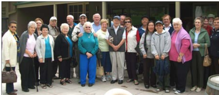
Vinska klet v mestecu Port Stephens.

V mesecu marcu smo šli na daljši izlet na obisk vinske kleti v Port Stephens in nato v Nelson Bay. V Port Stephens smo poskusili dobra vina in jih nekaj tudi nakupili, nakar smo odkrili v Nelson Bay čudovito restavracijo z imenom »Black Olive«, na dvignjeni terasi z razgledom na morje, še lepši pogled pa je bil na velike krožnike, napolnjene s pečenimi ribami, rakci, ostrigami na tri načine in drugimi školjkami, skupaj s prilogami, solato in dobrim vinom, tako, da so vsi glasovali, da se drug teden ponovno vrnemo že samo zaradi kosila. Po kosilu smo se vkrcali na udobno ladjo, ki ima verjetno dogovor z delfini, saj so nas prišli kaj kmalu pozdravit. In že je bilo pozno popoldne in čas, da se vrnemo domov. Naslednji mesec pa si bomo ogledali Illawara Fly Sky Walk nad drevesnimi krošnjami na Južni obali, s kosilom v Nowri. Nasvidenje!