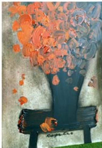
Still Life in Red - Tihozitje v rdečem

Stanislav Rapotec OAM, recipient of Blake Prize. His paintings are all over the world: The Museum of Modern Religious Art - Vatican; Paris; New York; Tinje - Austria; Kostanjevica - Slovenia and at many Australian Galleries and Embassies.