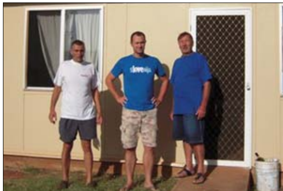
Pri Ivanu Pišotku.