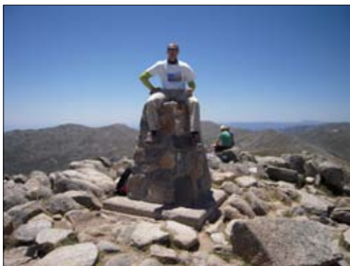
Na vrhu Avstralije.

Bilo je decembra 2009, ali pa mogoče konec novembra, v času kosila in pričele so se priprave za potovanje na daljni kontinent - Avstralijo. Preverjeni vsi podatki in informacije, kar jih je bilo možno pridobiti v tem kratkem času in z elektronsko vizo v roki sem stal na letališču Jožeta Pučnika. Dne 06.01.2010 ob 7.30 sem vstopil v letalo.