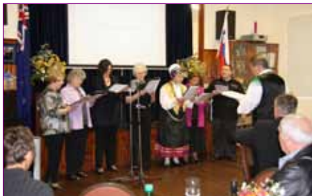
Cerkveni pevski zbor v Figtreeju je zapel slavljenco, 9.1.2011.